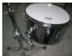
Primero 13" Steel Timbale w/ PPS36 Mount