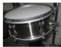
Q-Popper Timbale Snare 12"x5"