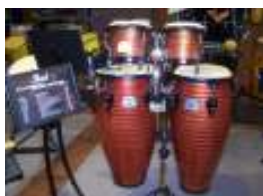
Primero Pro New Color