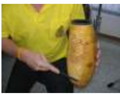
Natural Gourd Guiro