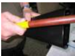
Phenolic Cowbell Beater 割れることなく、耐久性抜群