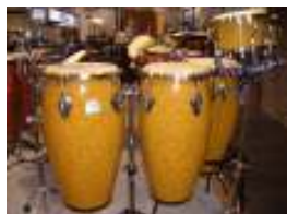
Candy Stripe & Gold Marble