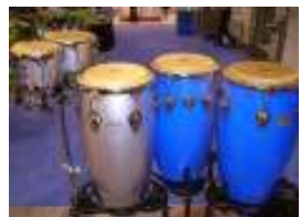
NEW Richie Flores Signature Congas & Bongos