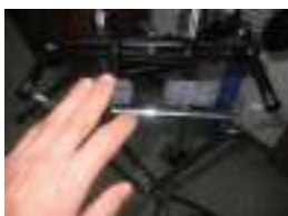
Stix-Free Triangle Holder